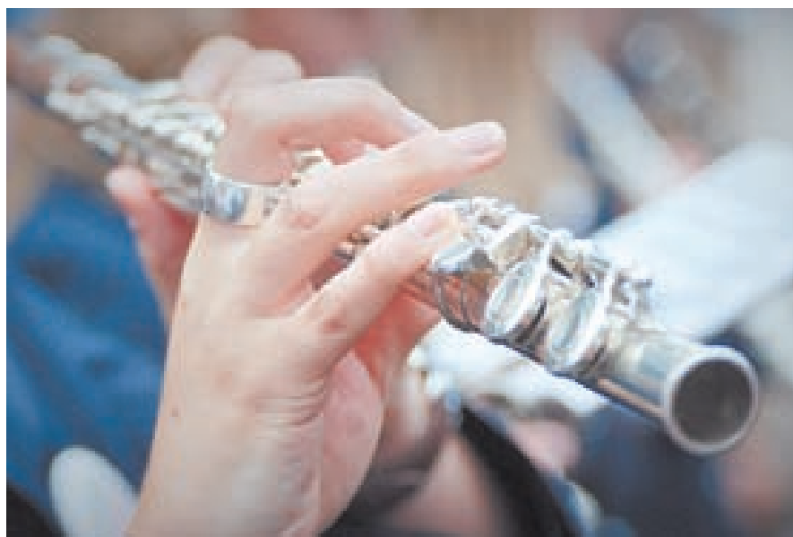
Els tallers musicals seran d’una durada de 45 minuts

Els pacients ingressats a les àrees de salut mental de l’Hospital del Mar, del Centre Fòrum, i del Centre Dr. Emili “podran interactuar amb la música i expressar les seves emocions a partir d’una activitat amb una extraordinària